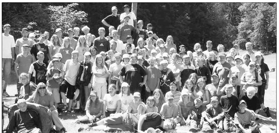
Ein ereignisreiches Zeltlager der St.-Clemens-Gemeinde Rheda verlebten die Teilnehmer im Schmallenberger Sauerland.

Schließlich hieß es dann: Zelte abbauen und alles startklar machen für die Heimreise.