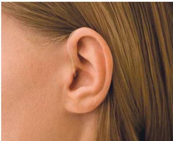
Am Ohr getragen glänzt das neue Made for iPhone durch eine sehr dezente Optik und größtmöglichen Hör- und Klangkomfort.